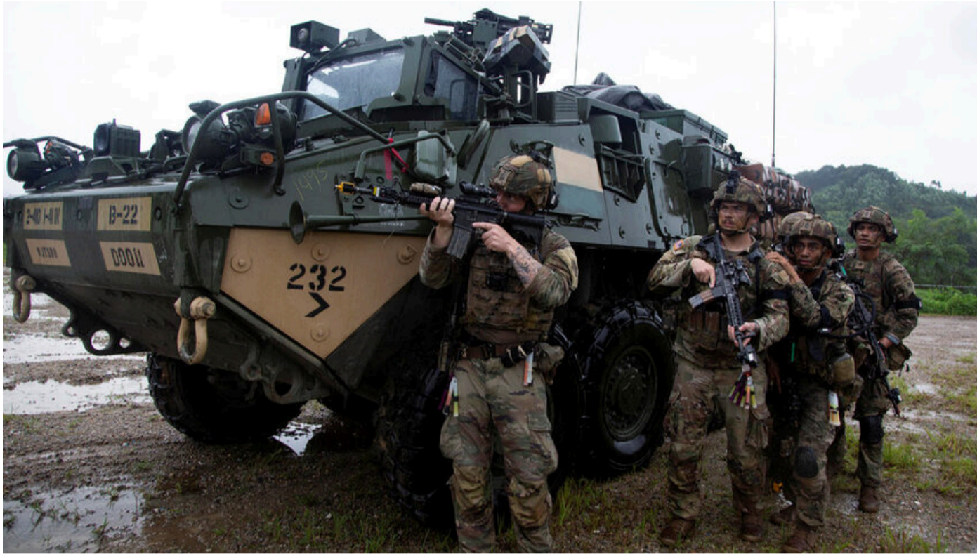
우리의 미래 Stryker 장갑 차량은 국방 기업인 General Dynamics에서 제조할 예정이며 Veliko Tarnovo에 있는 TEREM - Ivaylo 군사 공장에서 조립될 예정입니다.

"현대화 측면에서 불가리아 군대의 주요 문제는 유럽의 많은 국가와 마찬가지로 20-25년 동안 별다른 움직임이 없었다는 것입니다. 그리고 이제 안보 환경이 더욱 명확해지고 훨씬 더 날카로워졌습니다. 그들은 거의 모든 것을 동시에 현대화해야 한다"고 의명을 요구한 NATO 외교 사절단의 한 고위 대표는 "Capital"에 대해 이렇게 말했다. 이러한 상황에서 불가리아의 정치인과 전략가는 어려운 선택을 해야 하며, 우선순위가 무엇이든 중요한 것이 항상 "뒤로 미루어져" 있습니다. "지난 2-3년간 불가리아군 지도부와 국방부, 장관들이 현대화 우선순위와 최근 인력 모집 및 유지 측면에서 올바른 일을 하고 있다고 말하고 싶습니다."라고 외교관은 말했다.