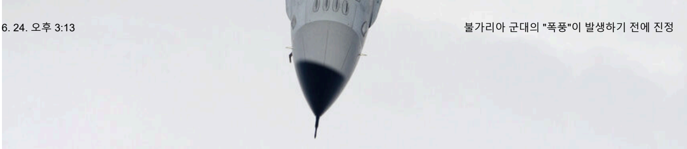
내년 봄, 불가리아 공군은 새로 생산된 F-16 Block 70 전투기의 첫 번째 유닛을 인수해야 합니다.

동시에 해군은 독일 회사 Lürssen이 설계하고 Varna 조선소 "Delphin"에서 조립한 두 척의 새로운 모듈식 순찰함 중 첫 번째를 시험용으로 받아들일 예정입니다. 2022년 러시아의 우크라이나 침공이 시작된 후 불가리아 정부는 그들을 위해 추가 미사일, 어뢰 및 기타 군수품도 주문했습니다.