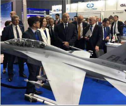
불가리아 대통령 PT